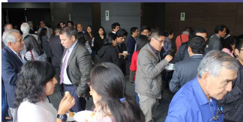
Momentos del coffee break ofrecido a los asistentes del evento.