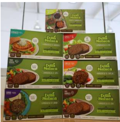
Las hamburguesas son su línea de producto más importante.

Luego de estimar un crecimiento de sus ventas de 8% para este año, Castro añadió que invertirán en la adquisición de un túnel de congelamiento y en máquinas