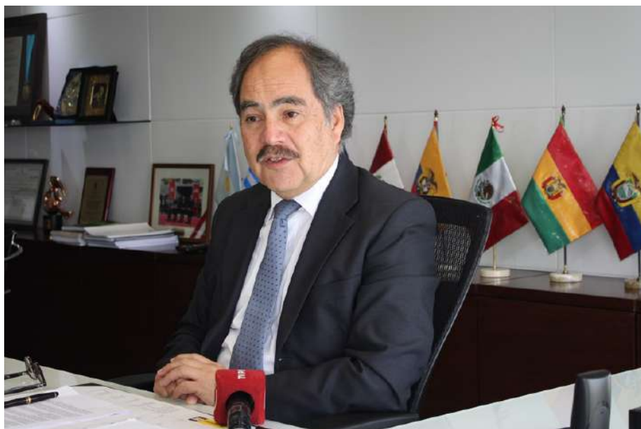
El presidente de ADEX, Juan Varillas

Destacó que las agroexportaciones presentan un crecimiento sostenido en los últimos años -tasa promedio de 13.8%- y resisten firmemente la crisis financiera internacional, debido a las diversas estrategias que se desarrollan para diversificar tanto productos como mercados. “Gracias a su buen desempeño, los envíos agroindustriales representan el 48% del total de exportaciones no tradicionales”, señaló.